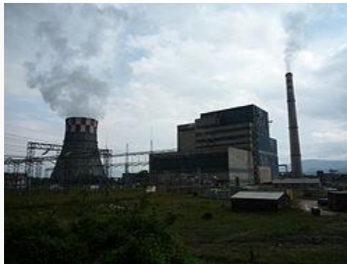
Термоелектрана у Гацку

Исто као што се некада налазило на раскршћу четири путна праваца који су водили на четири стране свијета, Гацко је у том положају остало и након реконструкције и модернизације спорих путних праваца, и у основи задржало свој ранији положај.