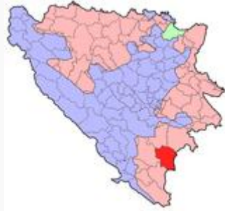
Положај општине Гацко у БиХ