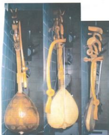
фот. 7: гусле Жарка Милића