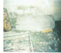
фот. 2: четвртина јаворовог дебла од ког ће се израдити гусле: на спољној, природној обради

Најпре се израђује карлица, доњи издубљени полулоптасти део гусала. Њена дужина треба да буде једнака држачу или мало већа, а никако мања и износи око 25-35 cm. Ширина се креће од 25 до 27cm. Најбоља дубина карлице јесте између 7 и 9cm, али има примера и дубљих. Дебљина дрвета на карлици износи 5-8 mm. По средини обавезно се оставља ојачање, нарочито код «дугмета», односно држача, то јест записача струна, да не би дошло до савијања гусла када се на њих распане струна.