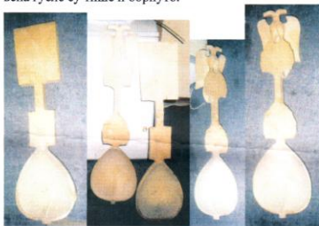
фот. 3: гусле у процесу обраде

Изнад чивије и «држача» израђује се «глава» гусала која може бити најразличитија и врло богато украшена. Најчешће се израђује глава дивокозе, двоглави орао као и изрезбарени ликови великана српске историје као што су Вук Караџић, Марко Краљевић, Петар Петровић Његош и многи други (сл. 5-11), док се ликови из новије историје, бар код вишеградских градитеља, не јављају. Поред главе, и тело гусала може бити украшено резбаријама, што зависи од инспирације и умећа мајстора или, ређе, наручиоца гусала. Интересантно је схватање које је општеважеће међу вишеградским гусларима и градитељима, да глава гусала треба да буде начињена од што мањег дрвета јер то, по њиховом мишљењу, утиче на звучност инструмента: што је глава већа гусле су тише и обрнуто.