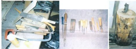
фот. 4: алат којим се израђују гусле

Висина кобилице, а самим тим и одвојеност струна од коже износи 2,5-3,5 cm. Њена дебљина требало би да буде што је могуће мања, а димензије могу ићи од 2,5 до 5 mm. Дужина кобилице са доње стране на којој се налазе стопала која налажу на кожу, креће се од 9 до 12 cm, а сама стопала кобилице дугачка су 2,5-3,5 cm и најчешће нису исте дужине. На кожу се постављају увек мало укусо.