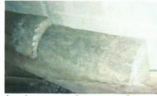
фот. 1: четвртина јаворовог дебла од ког ће се израдити гусле

висини у шуми, односно оно које је најизложеније сунцу. Такође је добро да има што више година. Првих метар ипо се одбацује, пошто се налази у аду, 2 те није добро за израду инструмента, а узима се горњи део стабла. Дебло јавора се затим расцепљује (а не реже) на четири дела (сл. 1). Пре грубе обраде расцепљене четвртине се најпре суше. Најбољи резултат се добија ако се сушење врши у затвореним просторијама у којима нема влаге, мада се могу кратко и на диму сушити. Пред саму обраду, дрво се још једном износи напоље да га природа сама греје и хлади 3 (сл. 2). Тако припремљено дрво најпре се грубо обрађује, односно почиње да добија изглед гусала (сл.4). Након тога следи поновно сушење дрвета, тако да је до коначног изгледа потредно да прође и по неколико месеци. Процес израде гусала је постепен и спор.